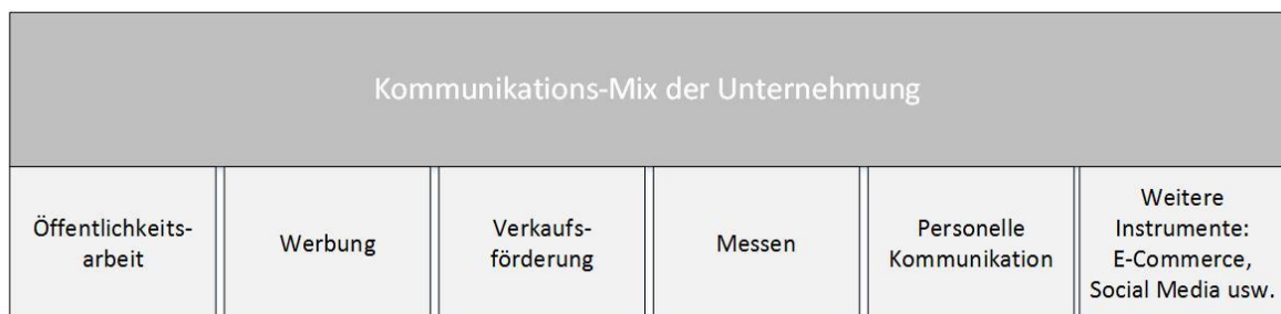
Abb. 4: Kommunikations-Mix.